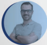
Ft. Serafin Ortigueira